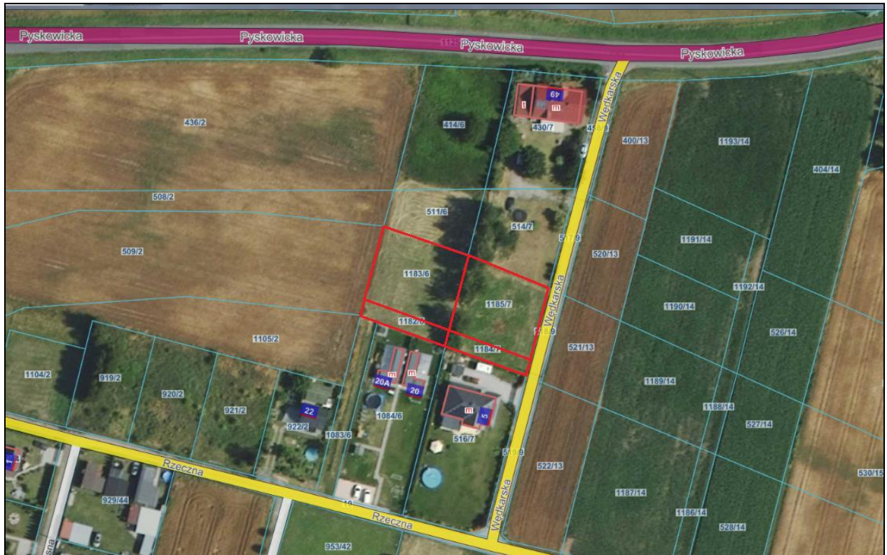
Rysunek 1. Działki przeznaczone do sprzedaży zostały zaznaczone kolorem czerwonym