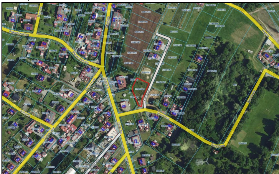
Rysunek 1 Działka przeznaczona do sprzedaży została zaznaczona kolorem czerwonym

Nieruchomość stanowiąca przedmiot sprzedaży położona jest w miejscowości Taciszów na skrzyżowaniu ulic Sportowej i Klonowej. Teren jest płaski, porośnięty trawą. Otoczenie stanowi zabudowa mieszkaniowa oraz łąki (Rysunek 1).