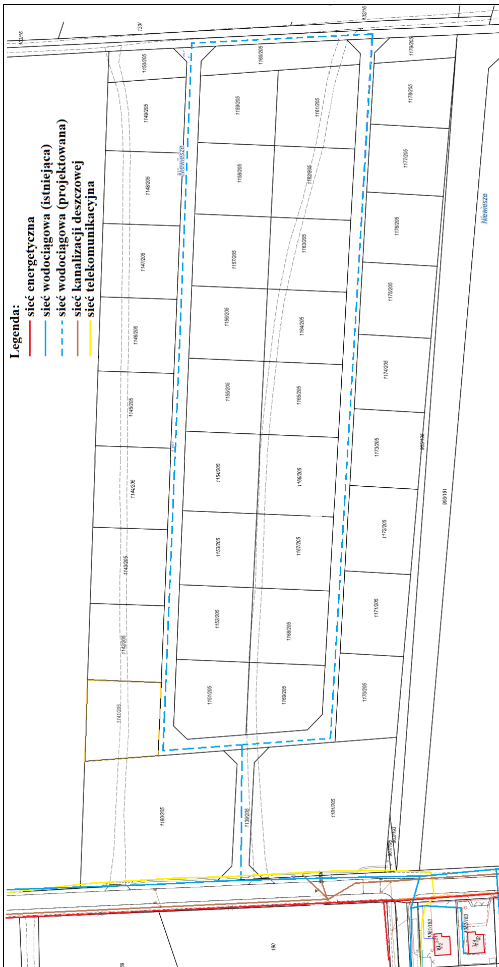
Rysunek 2 Fragment mapy z rozmieszczeniem sieci infrastruktury technicznej