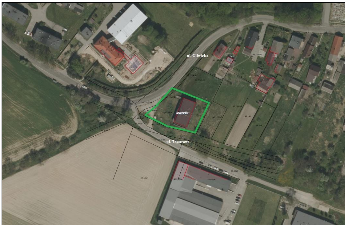
Rysunek 1 Działka przeznaczona do sprzedaży oznaczona kolorem zielonym

Działki nr 1255/39 oraz nr 1256/39 o łącznej powierzchni 0,1982 ha położone są w Poniszowicach przy ul. Gliwickiej 67 i jako jedna nieruchomość tworzą kształt zbliżony do trapezu. Sąsiedztwo stanowią szkoła podstawowa i hala sportowa, budynki mieszkalne i użytkowe oraz tereny użytkowane rolniczo. Nieruchomość posiada bezpośredni dostęp do publicznej drogi powiatowej nr 2939 S (ul. Gliwickiej).