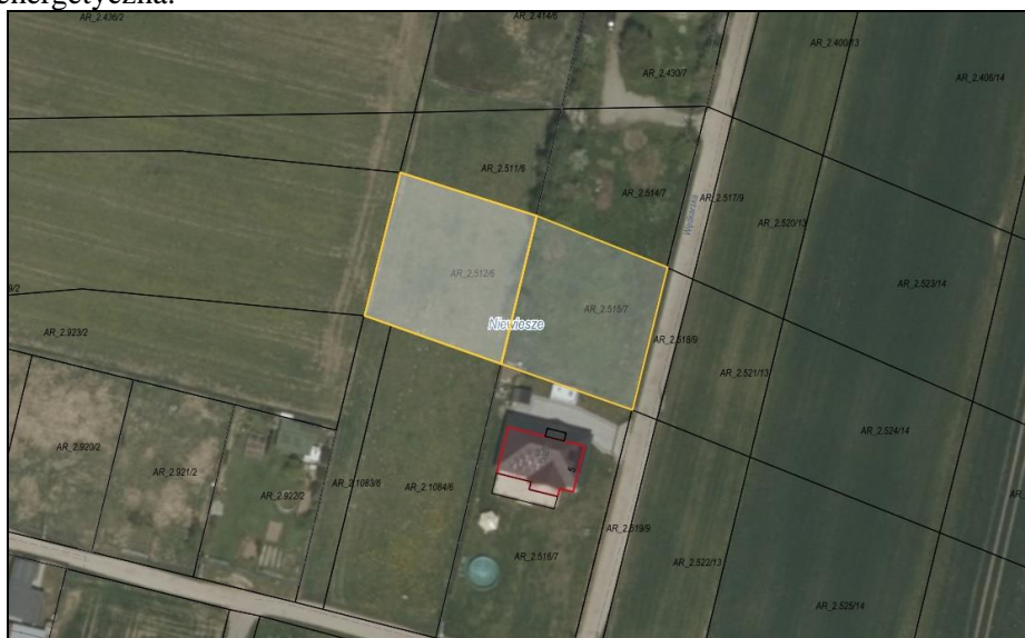
Rysunek 1 Działki przeznaczone do sprzedaży zaznaczono kolorem żółtym

Z treści mapy zasadniczej (udostępnionej przez Starostę Gliwickiego w ogólnodostępnym portalu mapowym WebEWID) wynika, że w bliskim sąsiedztwie nieruchomości znajdują się sieci: wodociągowa oraz elektroenergetyczna.