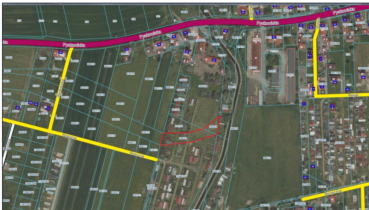
Rysunek 1 Obszar przeznaczony do sprzedaży zaznaczono kolorem czerwonym

Działki stanowiące przedmiot sprzedaży położone są w miejscowości Niewieszce, w rejonie ulicy Rzecznaj. Sąsiedztwo stanowią tereny wykorzystywane rekreacyjnie oraz tereny użytkowane rolniczo. Działki są płaskie i tworzą kompleks o kształcie zbliżonym do trapezu. Od strony zachodniej i wschodniej działki otoczone są gruntami stanowiącymi własność Skarbu Państwa, reprezentowanego przez Starostę Gliwickiego, natomiast od strony północnej i południowej działki otoczone są gruntami stanowiącymi własność osób fizycznych.