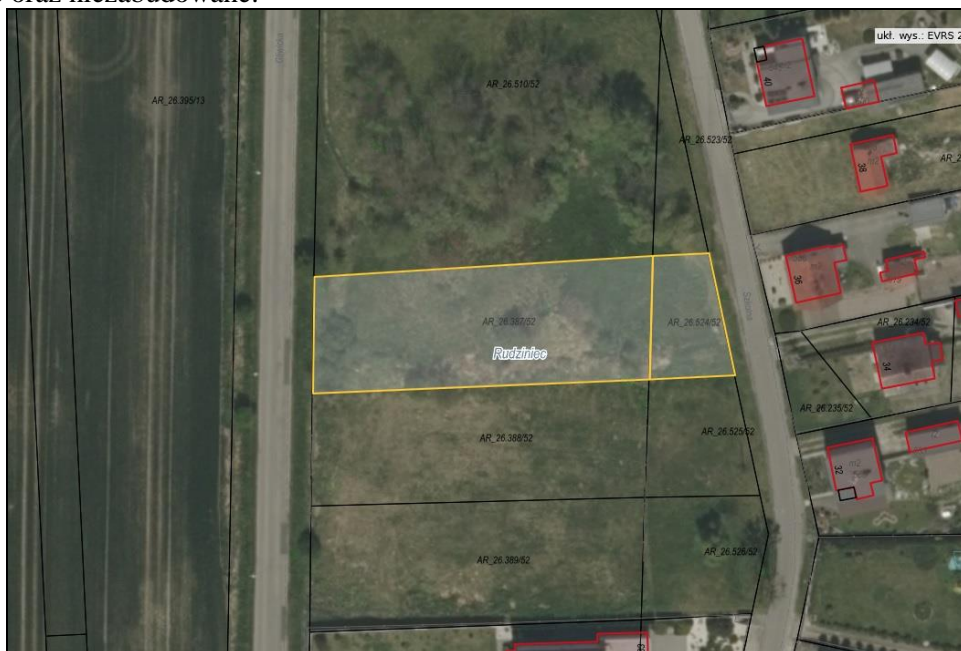
Rysunek 1 Działki przeznaczone do sprzedaży oznaczone kolorem żółtym

Działki położone są w miejscowości Rudziniec pomiędzy ulicami Szkolną i Gliwicką. Działki posiadają kształt zbliżony do prostokąta. Porośnięte są trawą i krzewami, płaskie, nieogrodzone. Teren rzeczonych działek jest obniżony w stosunku do poziomu gruntów sąsiednich. Dojazd odbywa się drogami o nawierzchni asfaltowej - ulicą Szkolną oraz Gliwicką w Rudzińcu. Sąsiedztwo stanowią tereny zabudowane oraz niezabudowane.