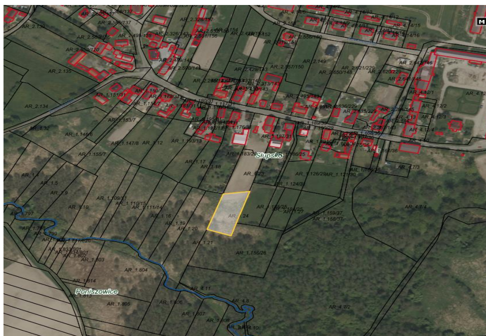
Rysunek 1 Obszar przeznaczony do dzierżawy oznaczono kolorem żółtym

Działka o numerze ewidencyjnym 24 o pow. 0,2090 ha położona jest po południowej stronie miejscowości Słupsko. Zgodnie z miejscowym planem zagospodarowania przestrzennego przez działkę przebiega rów melioracyjny (symbol w planie Wc) oraz linia elektroenergetyczna (symbol w planie EN 20kV). Działka posiada dostęp do drogi publicznej ul. Jagiellońskiej poprzez działki gminne nr 160/36, 158/37 oraz 156/26, a. m. 1, obręb Słupsko. Sąsiedztwo działki stanowią pola uprawne, łąki i lasy oraz zabudowa mieszkaniowa oddalona o ok. 80m. Zgodnie z rysunkiem miejscowego planu zagospodarowania przestrzennego przez teren działki przebiega ciek wodny oraz linia elektroenergetyczna 20kV.