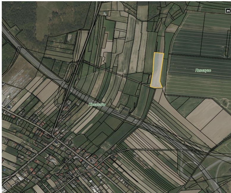
Rysunek 1 Obszar przeznaczony do dzierżawy zaznaczono kolorem żółtym

Działka o numerze ewidencyjnym 507/103 o pow. 1,3888 ha położona jest po północnej stronie miejscowości Kleszczów. Przez przedmiotową działkę przebiega rów melioracyjny (symbol w planie Wc). Działka nie posiada dostępu do drogi publicznej, co wiąże się z tym, że dzierżawca winien zapewnić sobie dostęp do działki własnym staraniem i na własny koszt. Sąsiedztwo działki stanowią pola uprawne oraz zabudowa mieszkaniowa oddalona o ok. 500m.