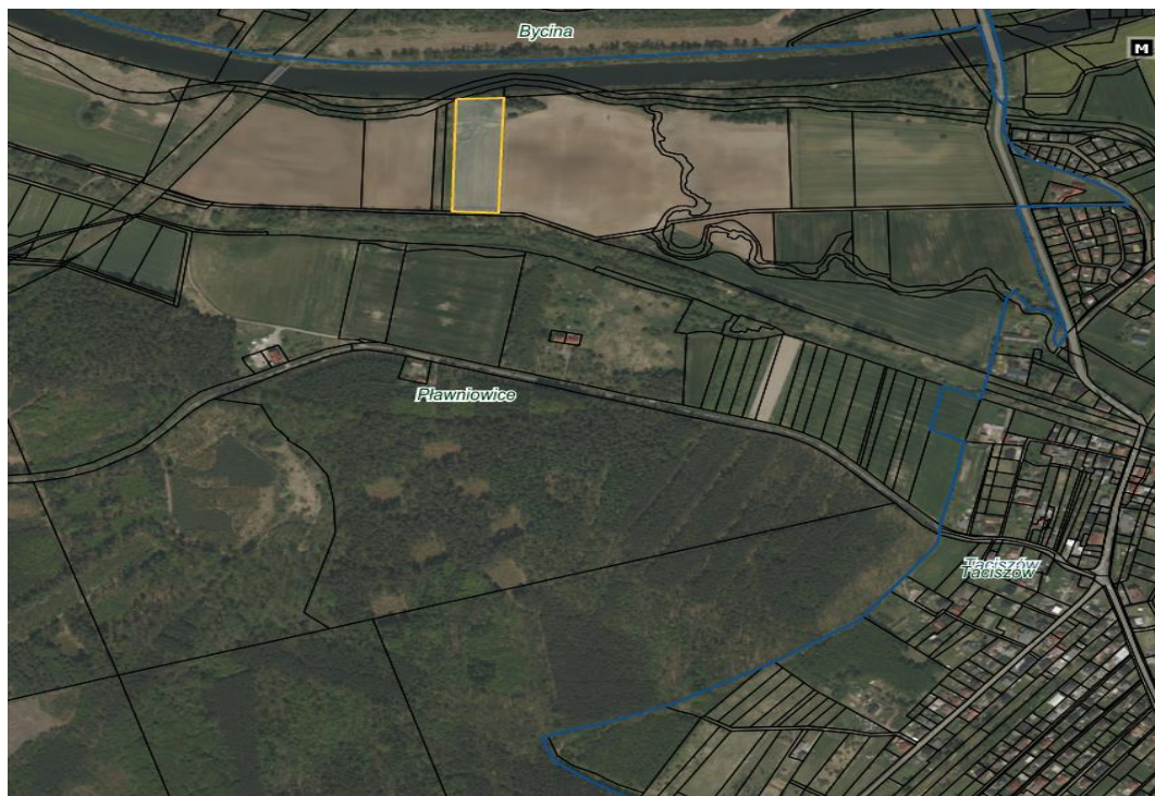
Rysunek 1 obszar przeznaczony do dzierżawy oznaczono kolorem żółtym

Działka o numerze ewidencyjnym 157/8 o pow. 1,2223 ha położona jest pomiędzy Pławniowicami a Taciszowem, po południowej stronie Kanału Gliwickiego. Działka nie posiada dostępu do drogi publicznej, co wiąże się z tym, że dzierżawca winien zapewnić sobie dostęp do działki własnym staraniem i na własny koszt. Sąsiedztwo działki stanowią pola uprawne.